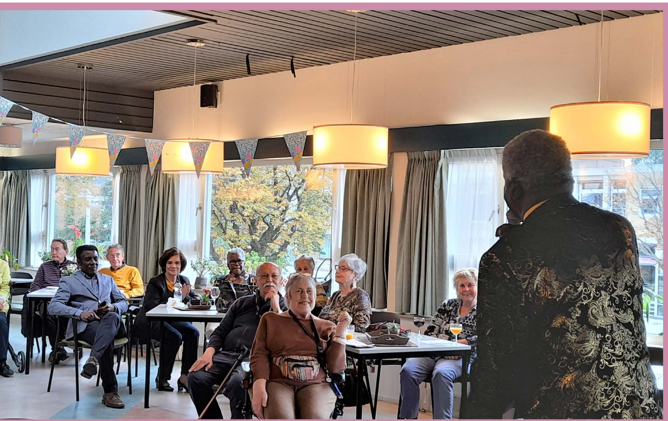
Culturele Huiskamer Emmahuis

Bij Durf te Dansen gaat het om moderne dansexpressie en wordt steeds toegewerkt naar een danspresentatie. Tijdens het Eurovisie Songfestival in mei heeft de groep gedanst op oude songfestivalliedjes en een presentatie op het plein voor de Bergsingelkerk gegeven.