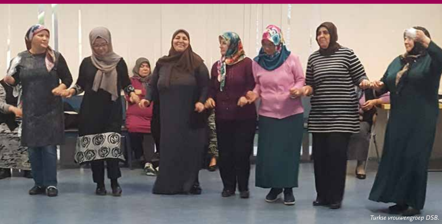
Turkse vrouwengroep DSB.

van de workshops en schreef een artikel over Anders Ouder Worden: www.zorgsaamwonencongres.nl/nieuws/20191119-ouderen-voor-ouderen-in-rotterdam Uit het artikel: “Hun geheim? Op laagdrempelige wijzen activiteiten organiseren waar ouderen behoefte aan hebben. Gedreven vanuit de werkwijze voor ouderen